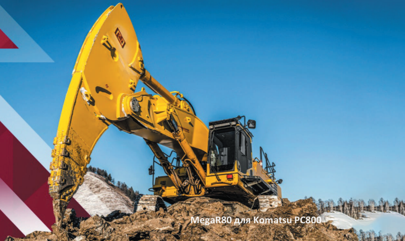
MegaR80 для Komatsu PC800

Компания «Профессионал» - ЛИДЕР российского рынка по продажам Мегарыхлителей в 2023 г. (реализовано более 150 шт.)